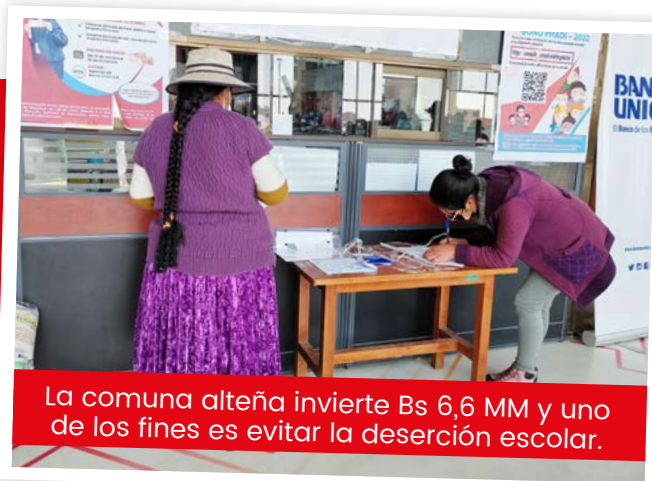
La comuna alteña invierte Bs 6,6 MM y uno de los fines es evitar la deserción escolar.