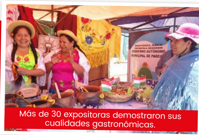
Más de 30 expositoras demostraron sus cualidades gastronómicas.

Los platos tarijeños y alteños fueron los de mayor demanda en el festival de la comida tradicional de mujeres vivanderas, que se realizó en Tilata. La segunda versión será en Tarija y la delegación de El Alto confirmó su participación.