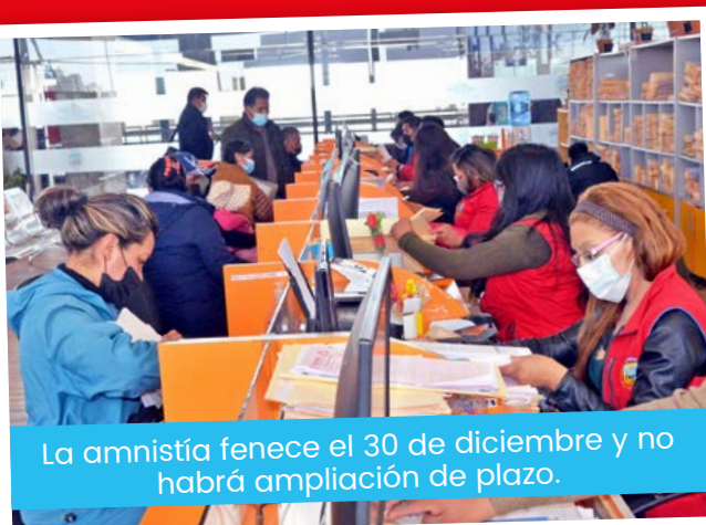
La amnistía fenece el 30 de diciembre y no habrá ampliación de plazo.