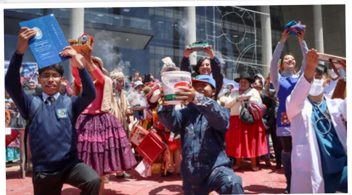
La algarabía se apoderó en la Casa Municipal, Jach'a Uta, donde comenzó la agenda de festejos.