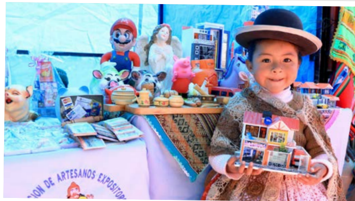
La creatividad de los artesanos es la herencia que queda en las familias para mantener viva la costumbre de la Alasita.