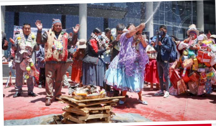
Con una ofrenda a la Madre Tierra la Alasita 2023 en El Alto comenzó con una agenda variada de actividades.