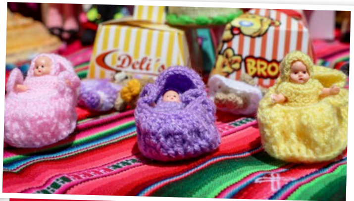
Las miniaturas en hilo y tejidos son una de las innovaciones para la fiesta del 'dios de la abundancia'.