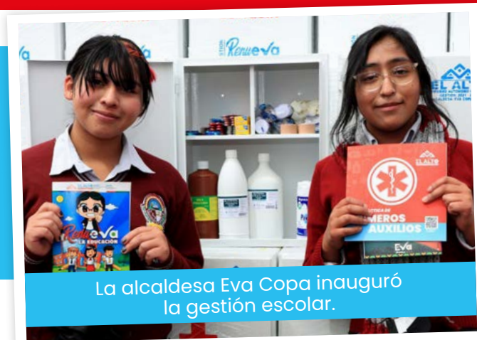
La alcaldesa Eva Copa inauguró la gestión escolar.

Con el fin de garantizar primeros auxilios para estudiantes y puedan contar con medicamentos, la alcaldesa de El Alto, Eva Copa, entregó el miércoles, por primera vez, 475 botiquines a las direcciones académicas de unidades educativas. Además, exhortó a los padres de familia a autorizar la vacunación a sus hijos contra la covid-19.