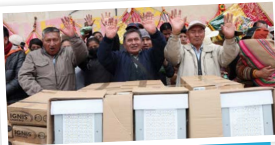
Población recibe con beneplácito la dotación de equipos.