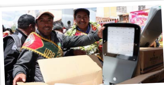
Muestras de cariño y agradecimiento a la alcaldesa Eva Copa.