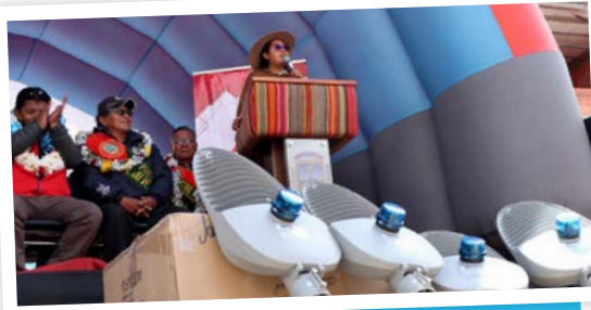
1.111 luces LED refuerzan la seguridad de 19 zonas.