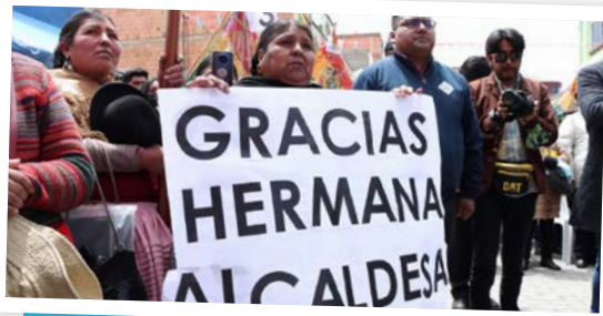
Vecinos rebosan de alegría por la dotación de lámparas.