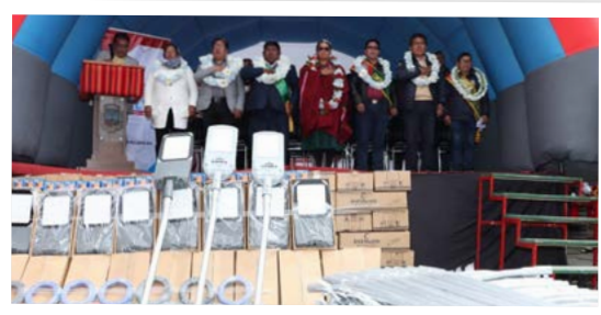
Vecinos de 22 zonas recibieron un lote de 1.277 luminarias LED.