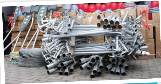
Más de mil paneles alumbran vías de la jurisdicción.