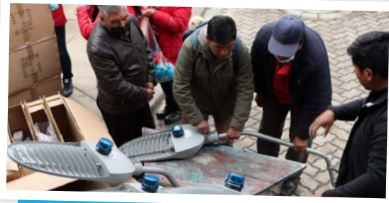
Entrega de las luces en presencia de dirigentes y vecinos.