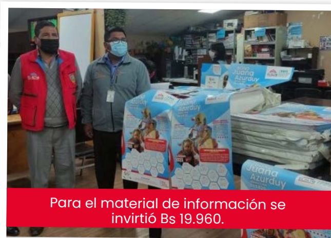
Para el material de información se invirtió Bs 19.960.

Con el fin de garantizar primeros auxilios para estudiantes y puedan contar con medicamentos, la alcaldesa de El Alto, Eva Copa, entregó el miércoles, por primera vez, 475 botiquines a las direcciones académicas de unidades educativas. Además, exhortó a los padres de familia a autorizar la vacunación a sus hijos contra la covid-19.