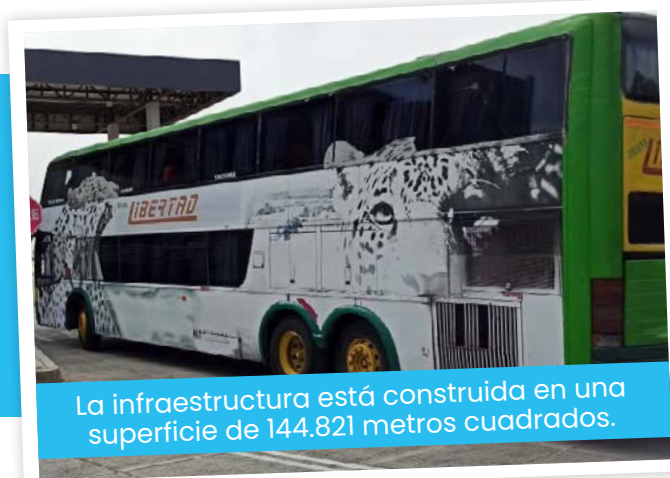
La infraestructura está construida en una superficie de 144.821 metros cuadrados.