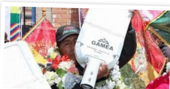
Un lote de 639 luces LED y accesorios coadyuvarán a la seguridad de los vecinos.