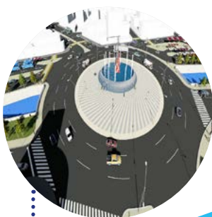
Distribuidor 'El Mallku'

5 distritos se beneficiarán con las obras